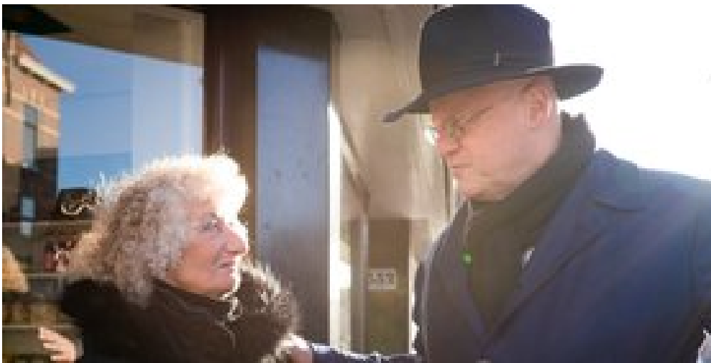
INTERVIEW FERDINAND GRAPPERHAUS